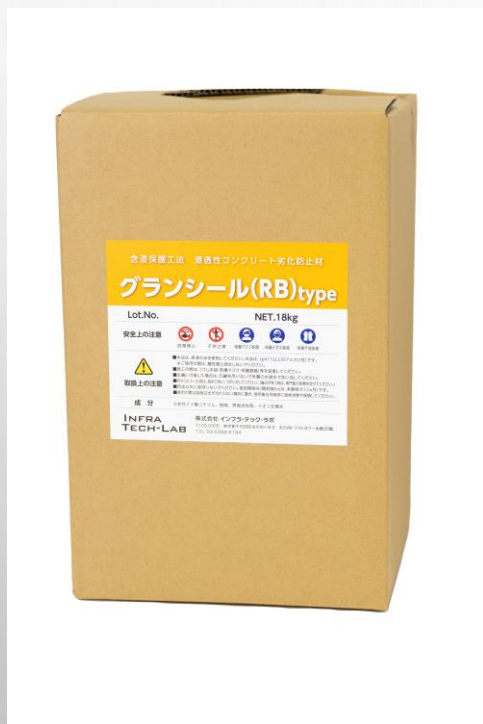
GranShield RBタイプ けい酸塩系リチウム