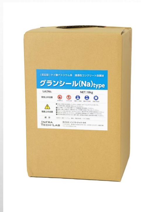
GranShield Naタイプ けい酸塩系ナトリウム